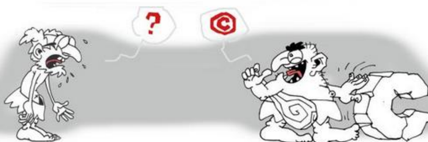
De oorsprong van auteursrechten ... © Nemo